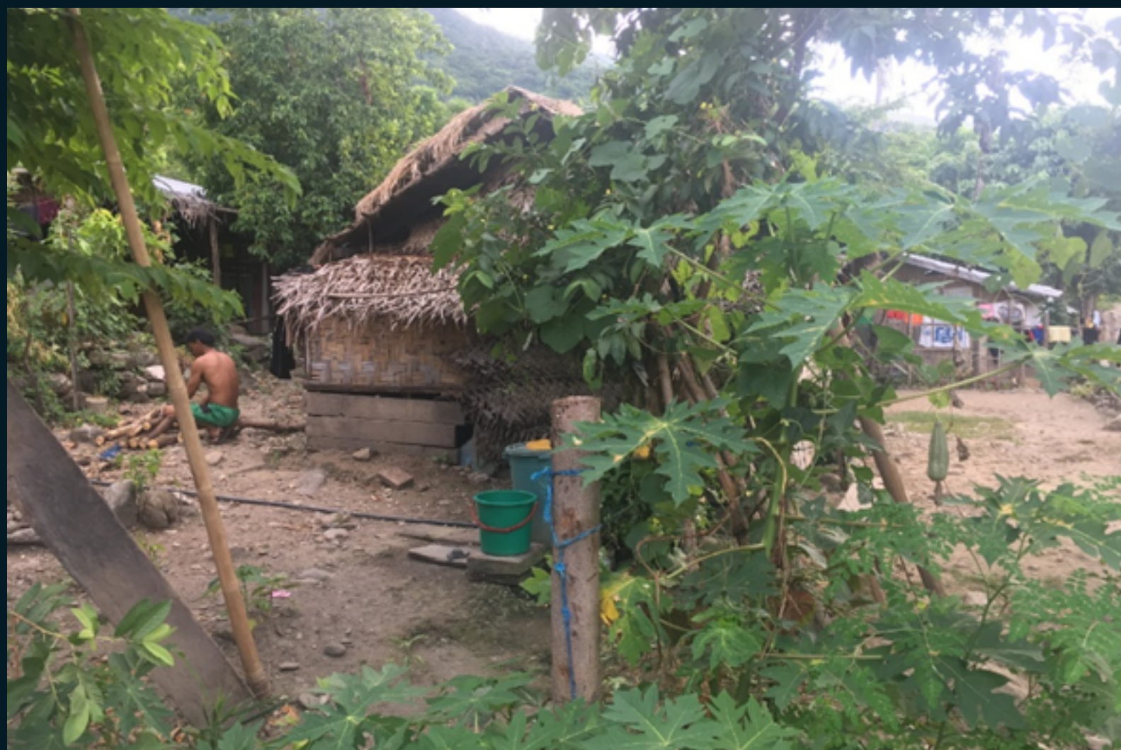
Figura 5: Habitações nas vilas

Kwon (2013) afirma que a construção de estruturas em alvenaria é um dos motivos do recente abandono da mobilidade dos Iraya.