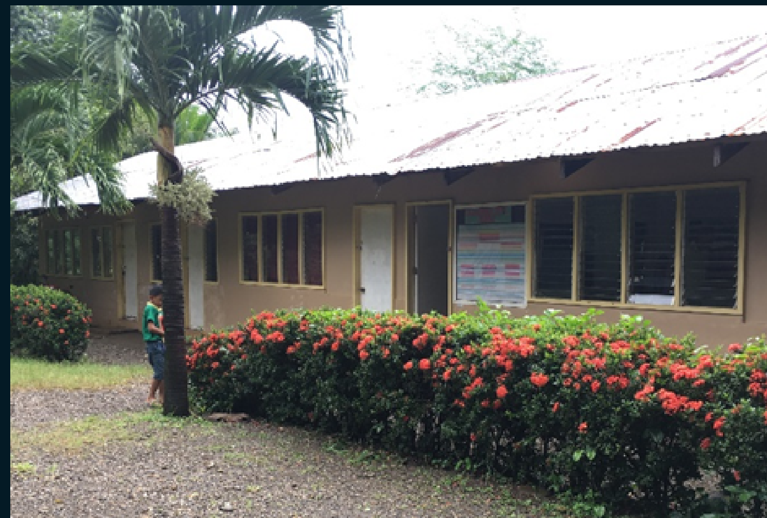
Figura 6: Campus de uma das escolas de Ensino Fundamental do projeto