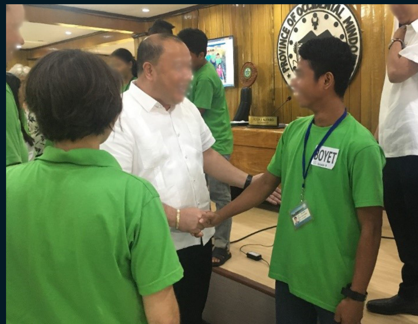
Figura 1: Alunos em visita ao comitê da província de Mindoro Ocidental

Seu fortalecimento se dá pela capacidade de ser enriquecido pelo contato com o outro, sem perder sua própria identidade.