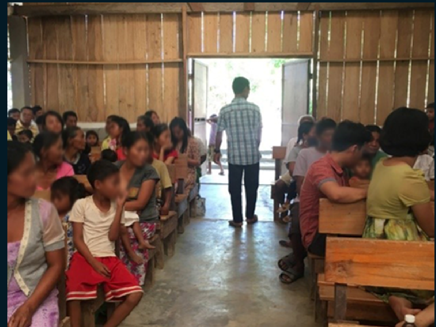
Figura 8: Igreja em uma das vilas alvo do projeto

Cultos em formato e construções de características ocidentais alertam para a falta de identificação dessas comunidades com o evangelho ao qual lhes foi apresentado.